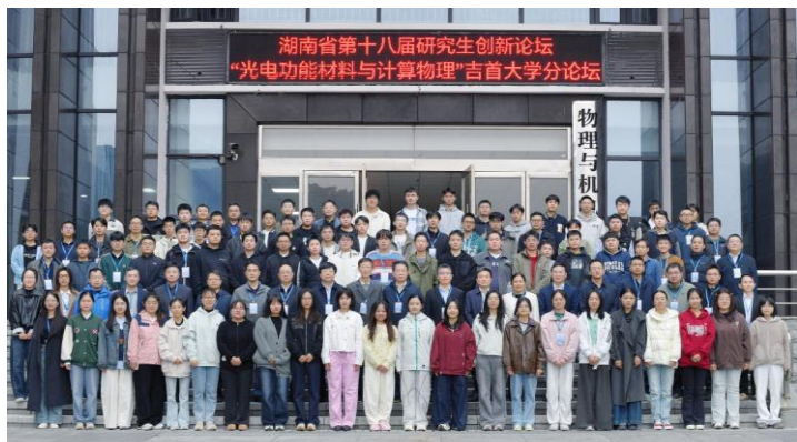
图为 学院承办湖南省研究生创新论坛