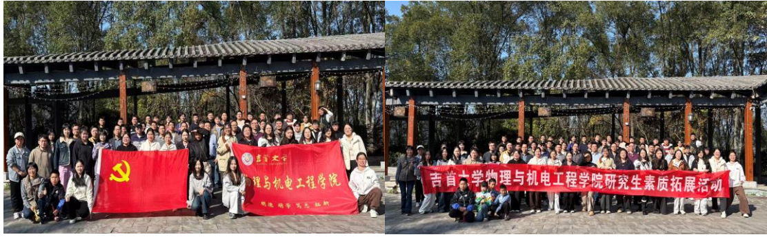
图为 学院开展研究生党日、团日活动、研究生素质拓展活动