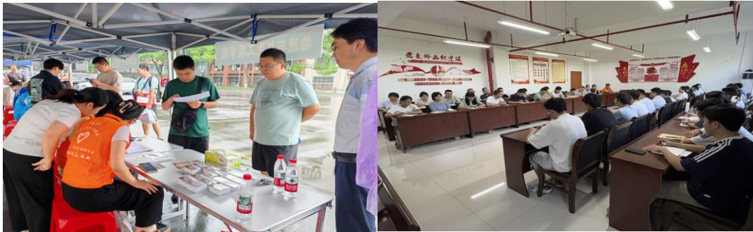
图为 学院开展 2025 级新生迎新工作与新生入学教育

(1) 通过开展爱校、爱院教育，帮助新入学学生深入了解学院院训和学院文化，加强学生的认同感和归属感，强化显性教育与隐性教育的统一。