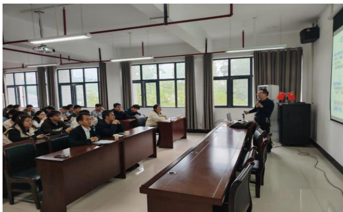
图为 学院邀请专家开展学术讲座

(3) 通过宣传工作，积极引导，进一步加强学位点文化建设。通过学院、研究生院或者学校网站对学院导师和学生发表高质量的论文和高质量人才培养进行广泛宣传，鼓励师生潜心研究、用心育人，创新科研。