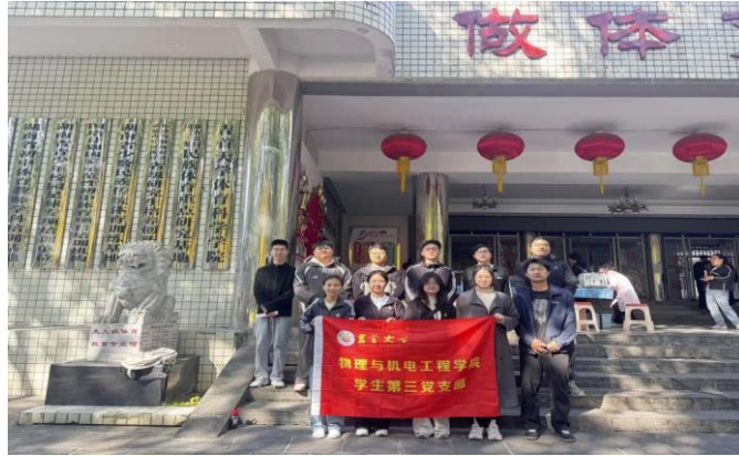
图为 学院研究生参加义务献血活动