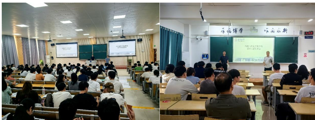
图为 研究生招生宣讲