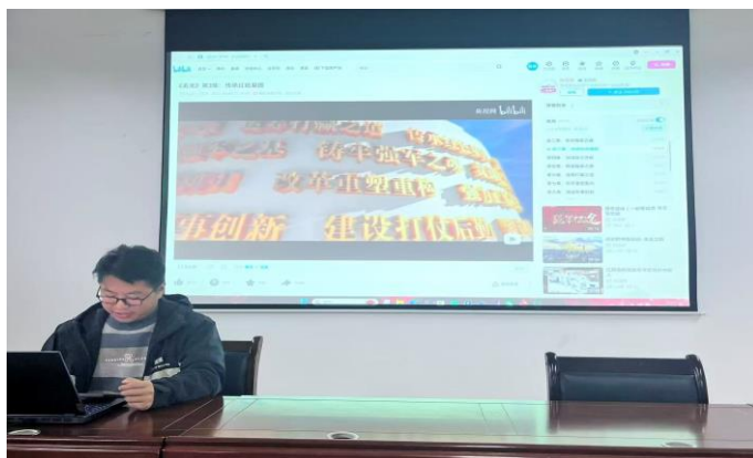
图为 研究生党支部开展理论学习

深入开展学习党的二十大精神、党的二十届三中、四中全会精神等理论学习，以学生党支部为入手点，充分发挥学生基层党组织的理论导向功能，并通过举办政治思想交流学习活动，引领学生树立正确的价值理念；以主题教育为切入点，开展爱国主义教育，通过开展入学教育、主题党日和团日活动、义务献血、素质拓展等方式，培养研究生的爱国之心、报国之志，最终促使其践行效国之行；以课程思政为落脚点，把以往知识理念灌输的传统思政培养方式，转变为把思政知识融于专业课程中，形成以学术促思政，以思政带学术的新培养模式。