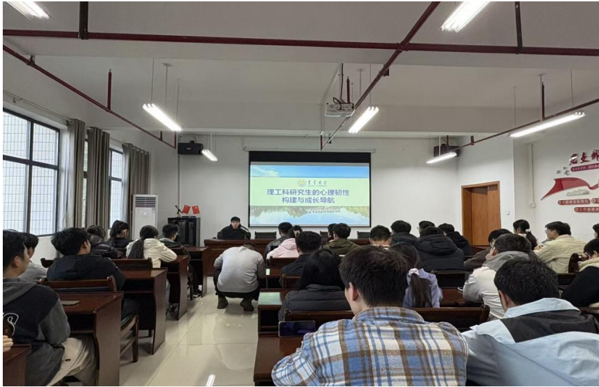
图为 学院开展研究生心理健康教育专题讲座

开展“院领导接待日”活动，扎实开展访企拓岗活动，将“俯下身”解难题与“贴近心”办实事相结合，真正解决学生实际困难，召开研究生座谈会。“走出去”与“引进来”双向发力，与省内外相关企业和院校建立了协同育人机制，为毕业生就业提供了广阔的平台。