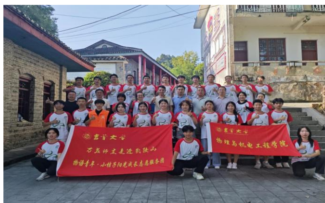
图为 学院开展暑期“三下乡”社会实践活动