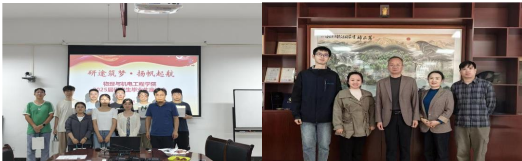
图为 学院开展毕业生座谈会与访企拓岗活动

开展“院领导接待日”活动，扎实开展访企拓岗活动，将“俯下身”解难题与“贴近心”办实事相结合，真正解决学生实际困难，召开研究生座谈会。“走出去”与“引进来”双向发力，与省内外相关企业和院校建立了协同育人机制，为毕业生就业提供了广阔的平台。