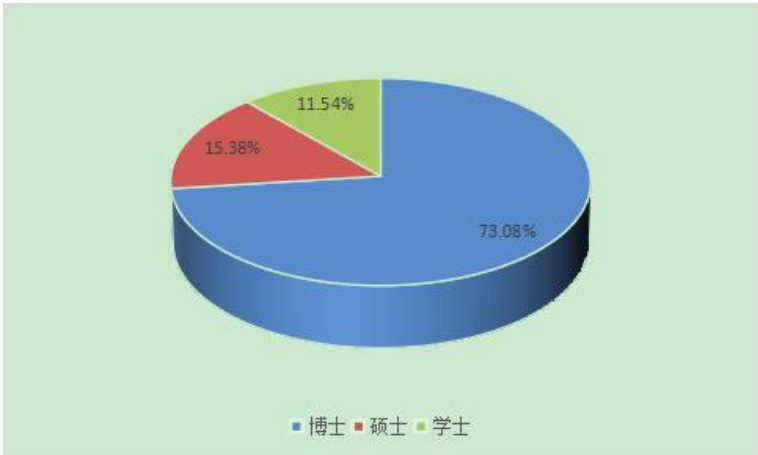
图 1.2 吉首大学博士生导师学位情况