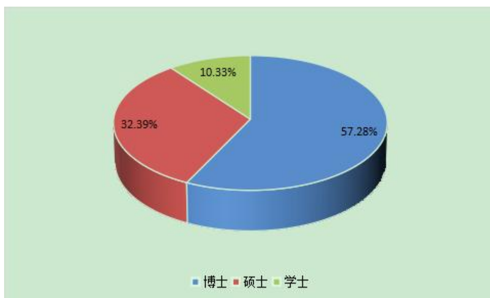
图 1.4 吉首大学硕士生导师学位情况