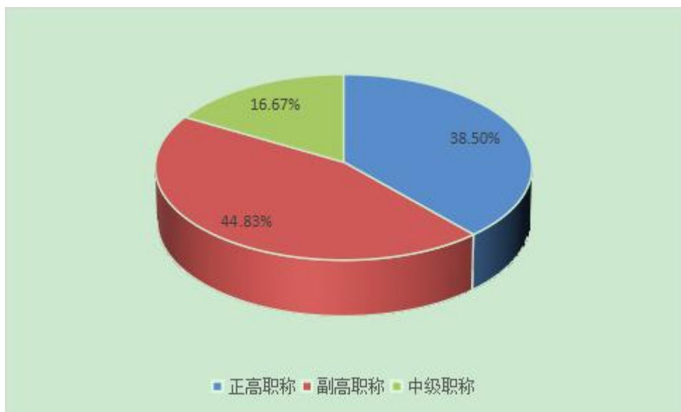
图 1.5 吉首大学硕士生导师职称情况