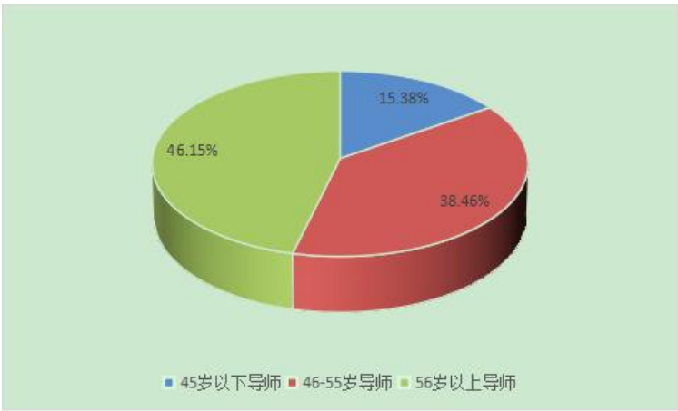
图 1.1 吉首大学博士生导师年龄情况

硕士研究生导师 804 人，其中校外兼职、基地导师 378 人，专业学位具有行业背景的兼职导师 300 余人。本学年共有 190 多位校外导师参与了学生学位论文及专业实践指导工作。研究生导师中有享受国务院特殊津贴专家有“国务院政府特殊津贴”专家 14 人，“新世纪百千万人才工程”国家级人选 1 人，教育部“新世纪优秀人才支持计划”6 人，文化名家暨“四个一批”人才工程 1 人、国家民委民族问题研究优秀中青年专家 1 人；湖南省“121 人才工程”人选、享受“湖南省政府特殊津贴”专家、湖湘青年英才、湖南省芙蓉学者、湖湘高层次人才聚集工程人选、湖南省跨世纪学术带头人、湖南省“芙蓉教学名师”、湖南省优秀中青年专家等共 51 人。导师年龄、学历结构合理，具体情况见图 1.1-1.5 和表 1.8。